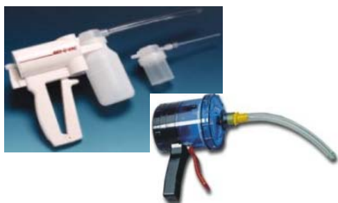
圖三 活動式抽吸器