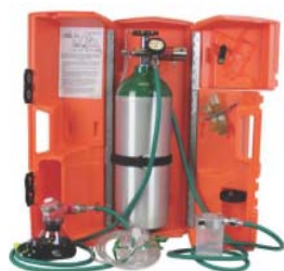
圖二-2：三合一甦醒器組合(範例二)

內容物：強迫給氣閥、減壓流量計、氣動抽吸器、 兒童用口呼吸道、成人用口呼吸道、成人 用氧氣面罩含 7 吋長導管、成人充氣式面罩 、高壓氧氣管(醫綠 6 吋長)、輪型轉盤含掛 鍊、塑膠攜行箱。