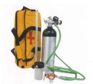
圖二-1：三合一甦醒器組合(範例一)