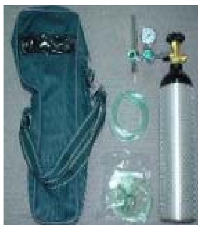
圖四 攜帶式氧氣組