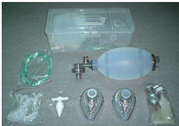
圖一 攜帶式人工甦醒器